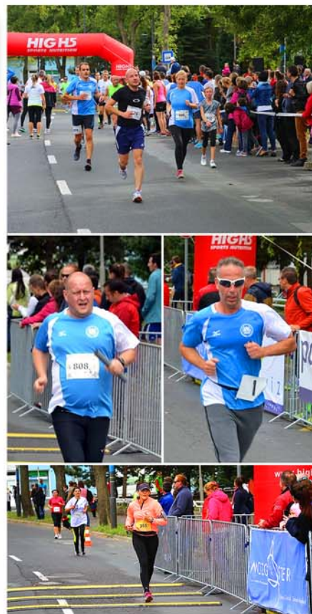
Beszámoló: Nagy Tibor

A Nyugat-magyarországi Egyetem épületével szemben a teljesen lezárt Károlyi Gáspár téri szakaszon volt a rajt, majd a Gagarin út - Jókai út - Nárai út - Dózsa György utca útvonalon haladva érkeztünk vissza 2,5 km után újra a célba. Az első két körben még egészen jó helyen állt a csapat, azonban a rivális csapatok erőemberei következtek és szédítő sebességgel száguldottak. Teljesítményünk a középmezőnyre volt elegendő, de ami a legfontosabb, hogy mindenki egy jót futott ezen a jól szervezett versenyen.