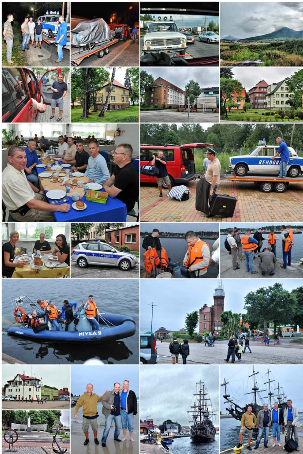
Beszámoló: Ribes Attila